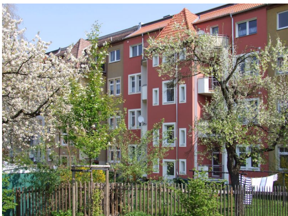
paul-Büttner-Straße 5, Freital-Potschappel